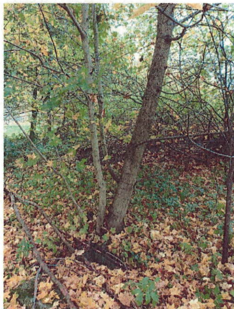
Drzewo do wycinki nr 3