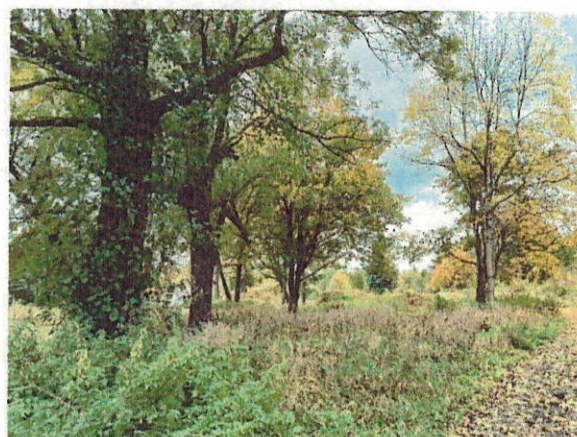
Drzewa do wycinki nr 8-10