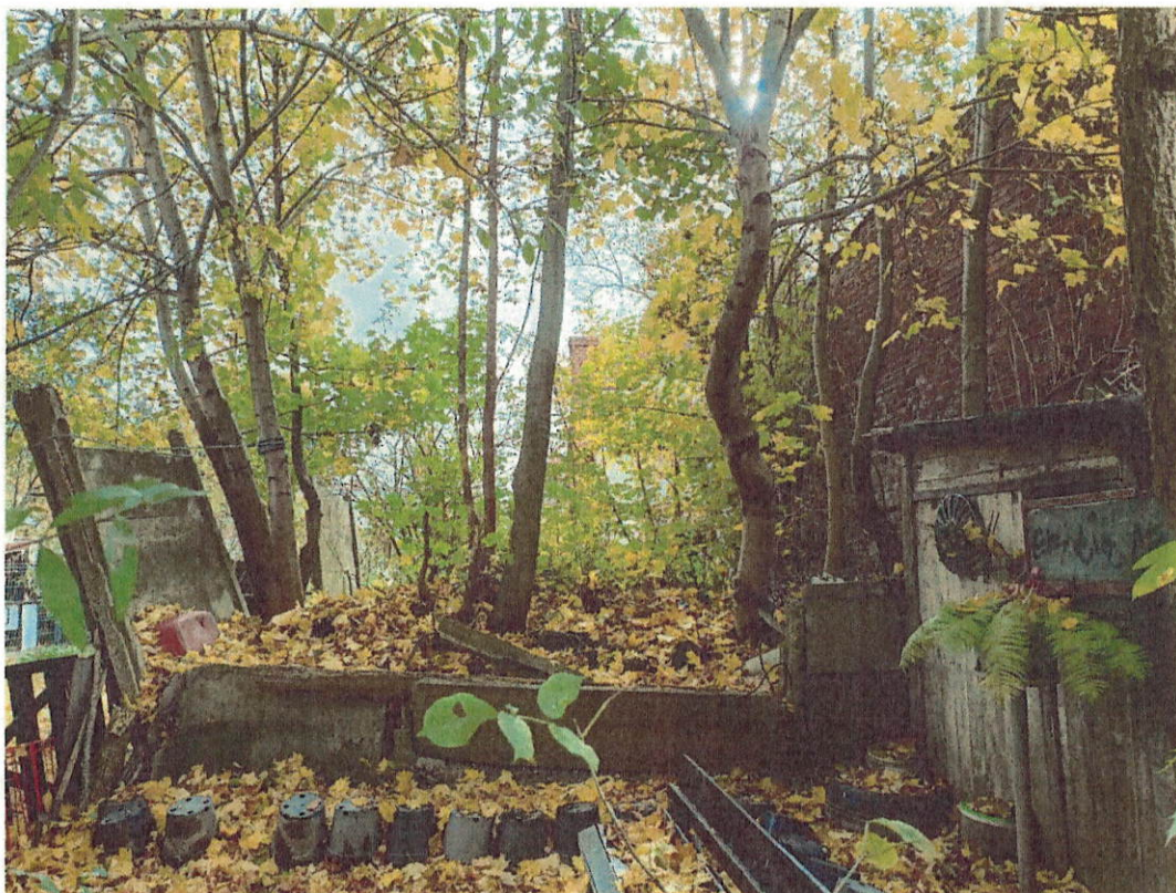
Drzewa do wycinki nr 13-17