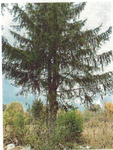
Drzewo do wycinki nr 6