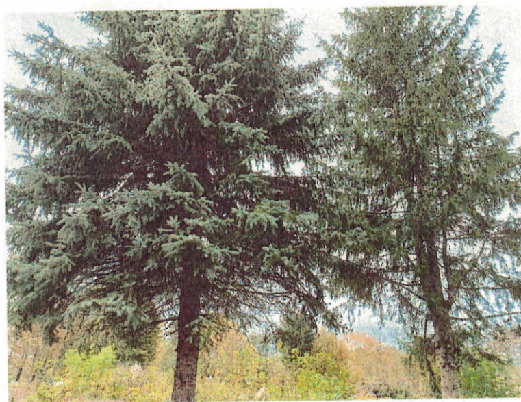
Drzewa do wycinki nr 6 i 7

WOJEWÓDZKI URZĄD OCHRONY ZABYTEKÓW we Wrocławiu DELEGATURA w JELENIEJ GÓRZE 58-500 Jelenia Góra, ul. 1-go Maja 2? tel. 75-75-26-86