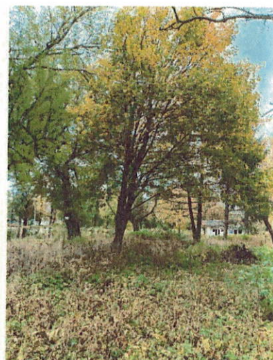
Drzewo do wycinki nr 9