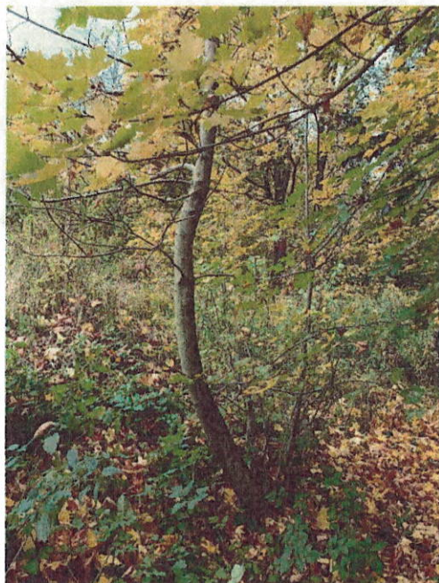
Drzewo do wycinki nr 1