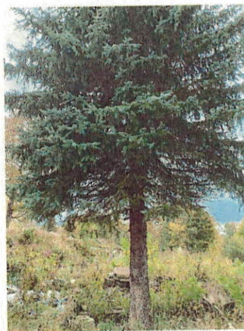
Drzewo do wycinki nr 7