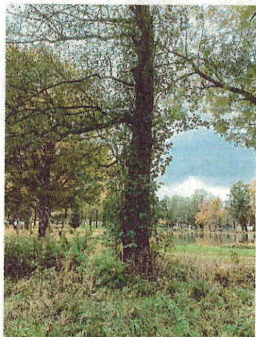
Drzewo do wycinki nr 10