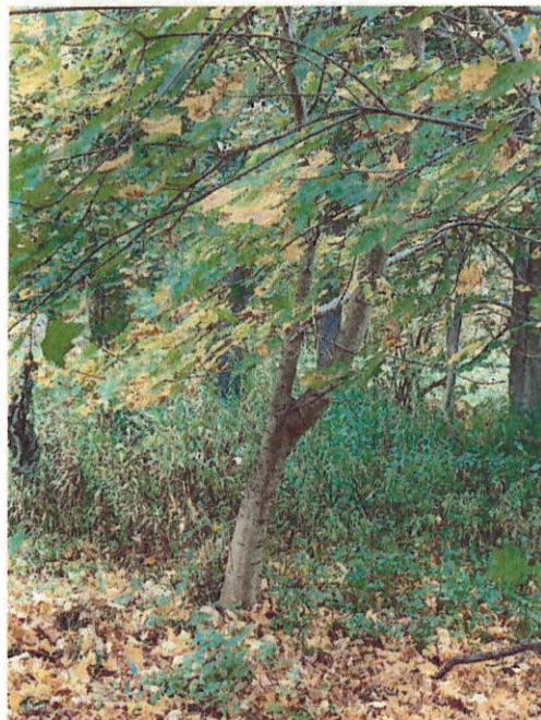
Drzewo do wycinki nr 2