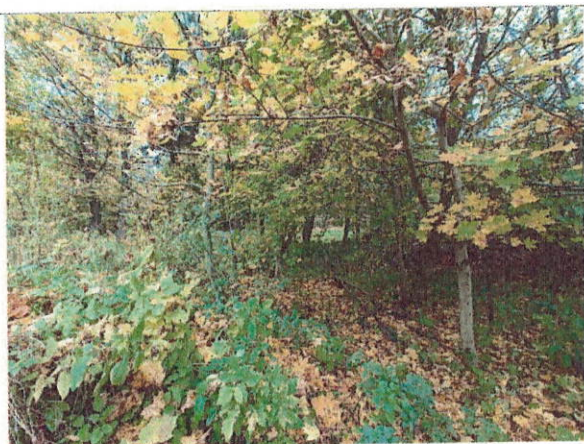
Drzewo do wycinki nr 1-5