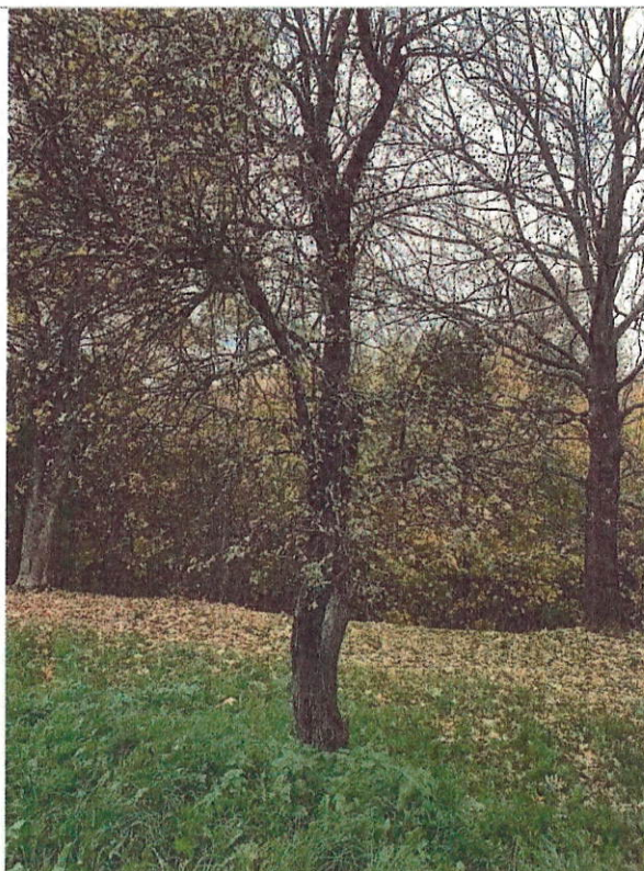
Drzewo do wycinki nr 18