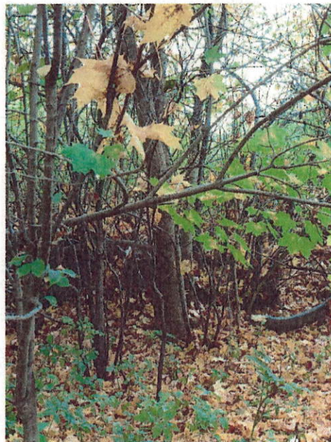
Drzewo do wycinki nr 4

WOJEWÓDZKI URZĄD OCHRONY ZABYTEKÓW W WE WROCŁAWIU