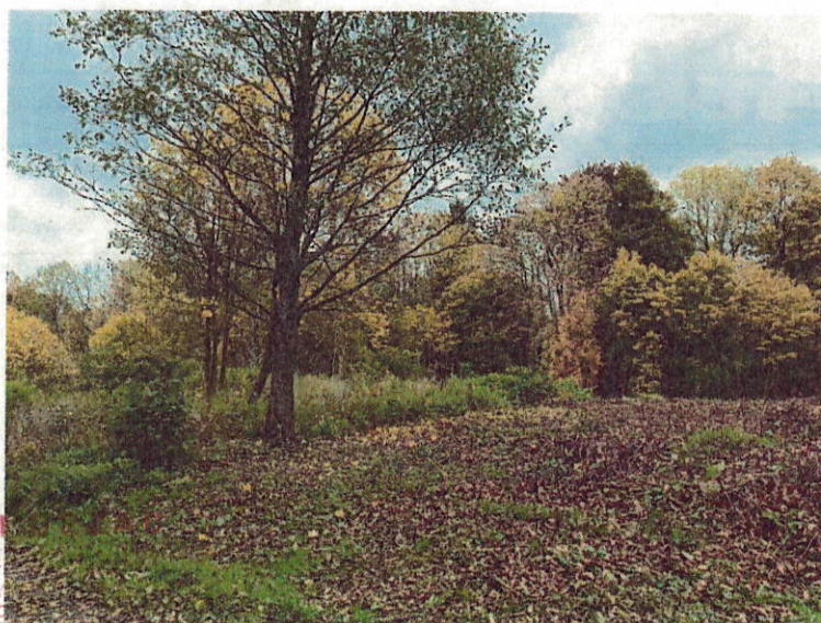
Drzewa do wycinki nr 11-12

WOJEWÓDZKI OCHRONY ZARZĄD we Wrocławiu DELEGATURA W JELENIE 48-500 Jelenia Góra, ul. 1-go Maja 7 tel. 75-75-26-865